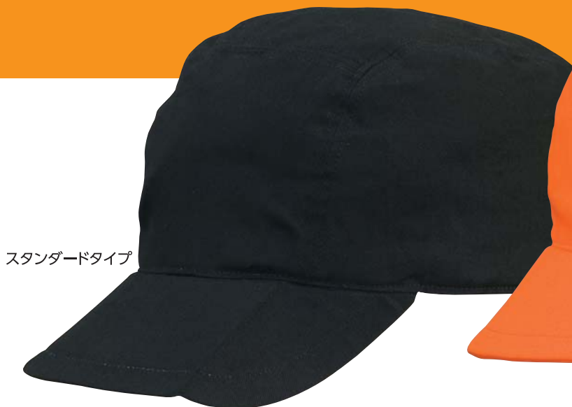
スタンダードタイプ