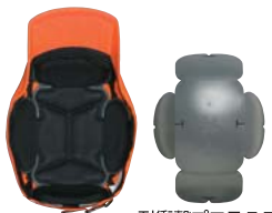
耐衝撃プロテクター (エコキャップ材)